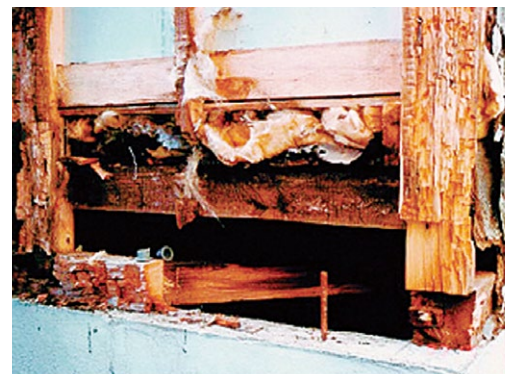
壁内に結露が発生し木材が腐朽した事例

施工ミスが原因の場合、お客様との関係性を崩し最悪の場合、会社の経営問題にも発展する場合があります。正しい施工が、健全な会社経営にも寄与します！